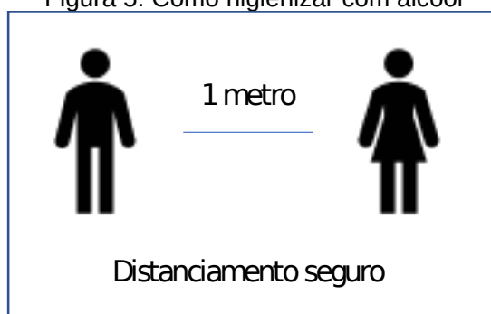
Figura 5: Como higienizar com álcool