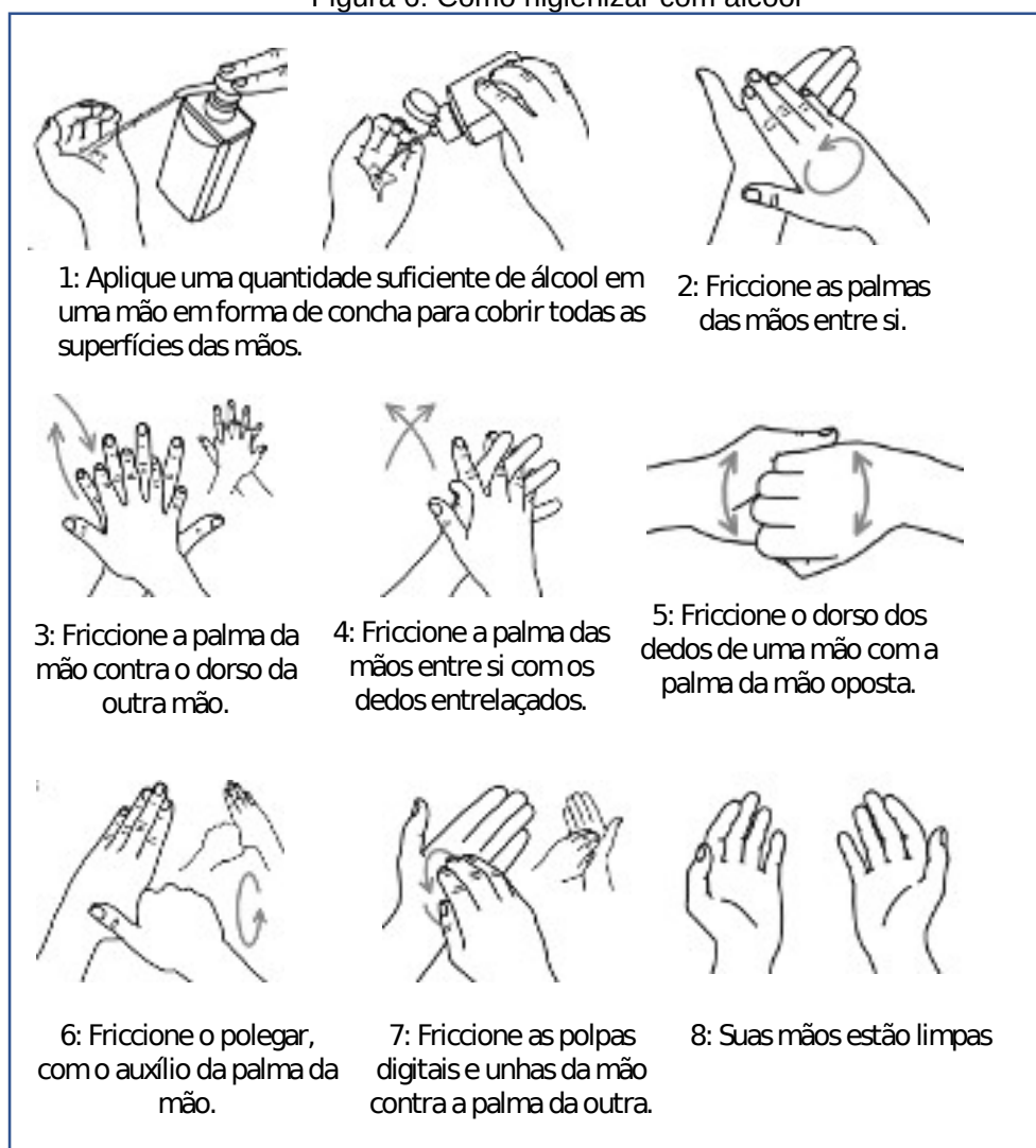
Figura 6: Como higienizar com álcool