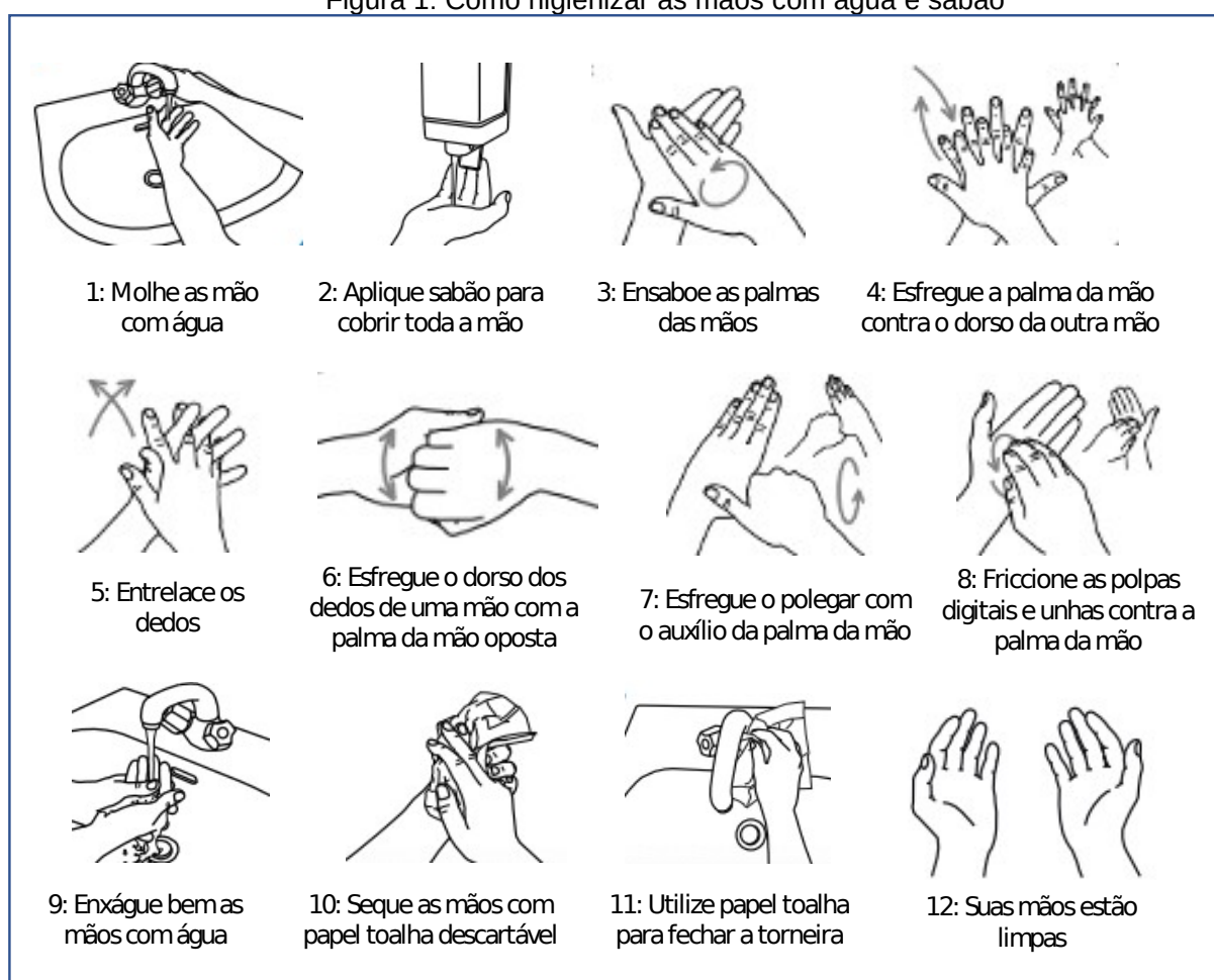
Figura 1: Como higienizar as mãos com água e sabão