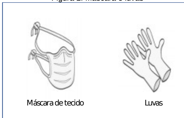
Figura 2: Máscara e luvas